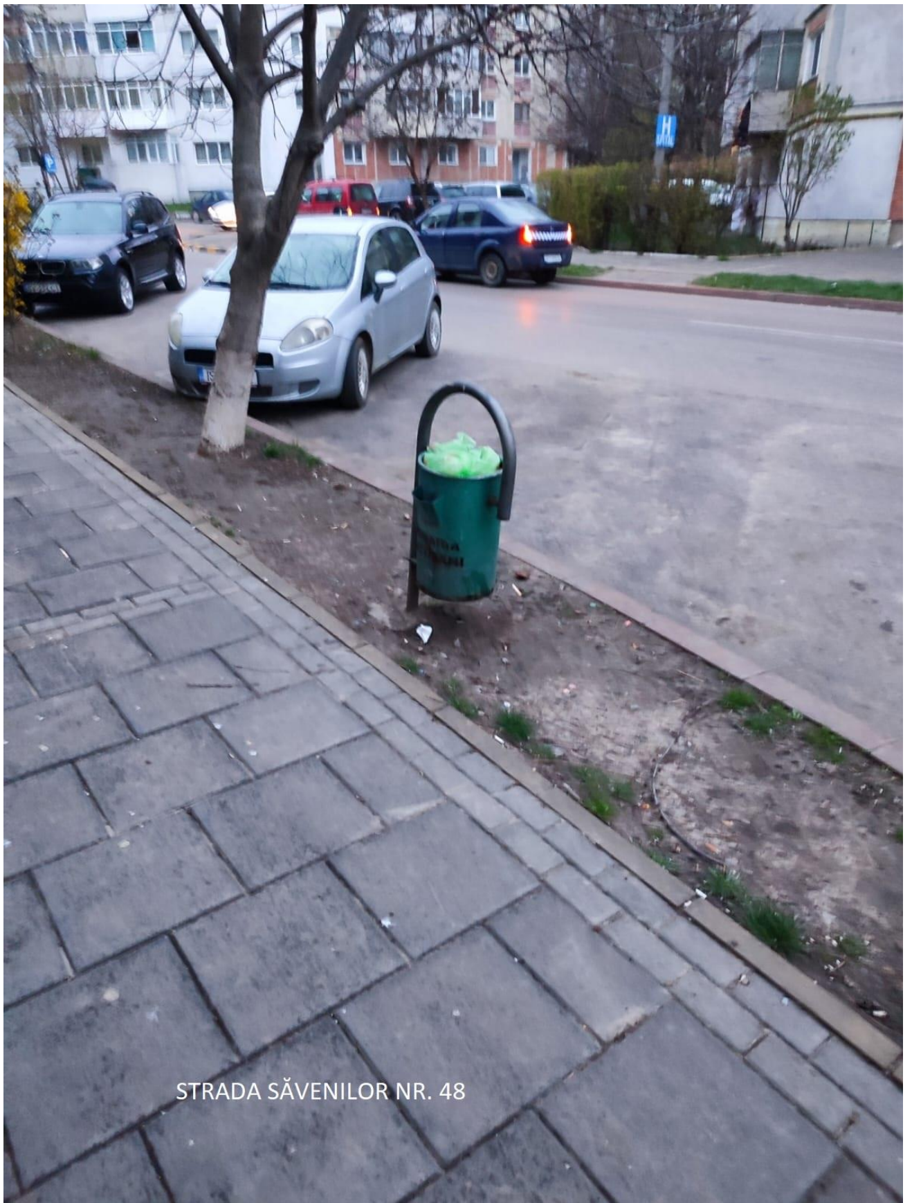
STRADA SĂVENILOR NR. 48