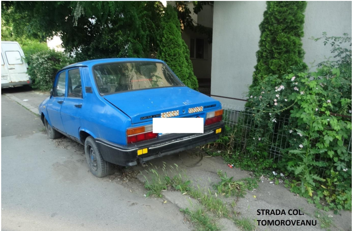
STRADA COL. TOMOROVEANU