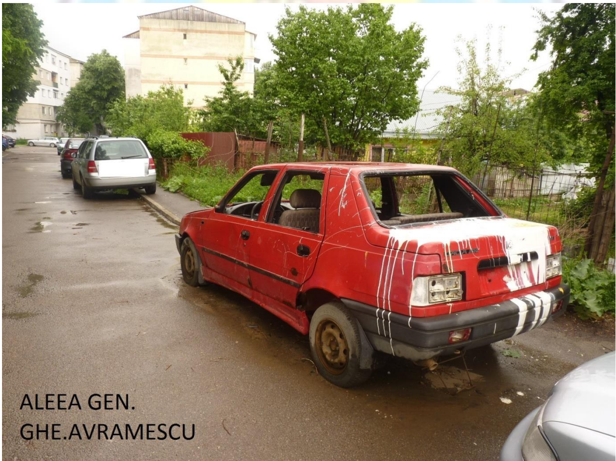
ALEEA GEN. GHE.AVRAMESCU