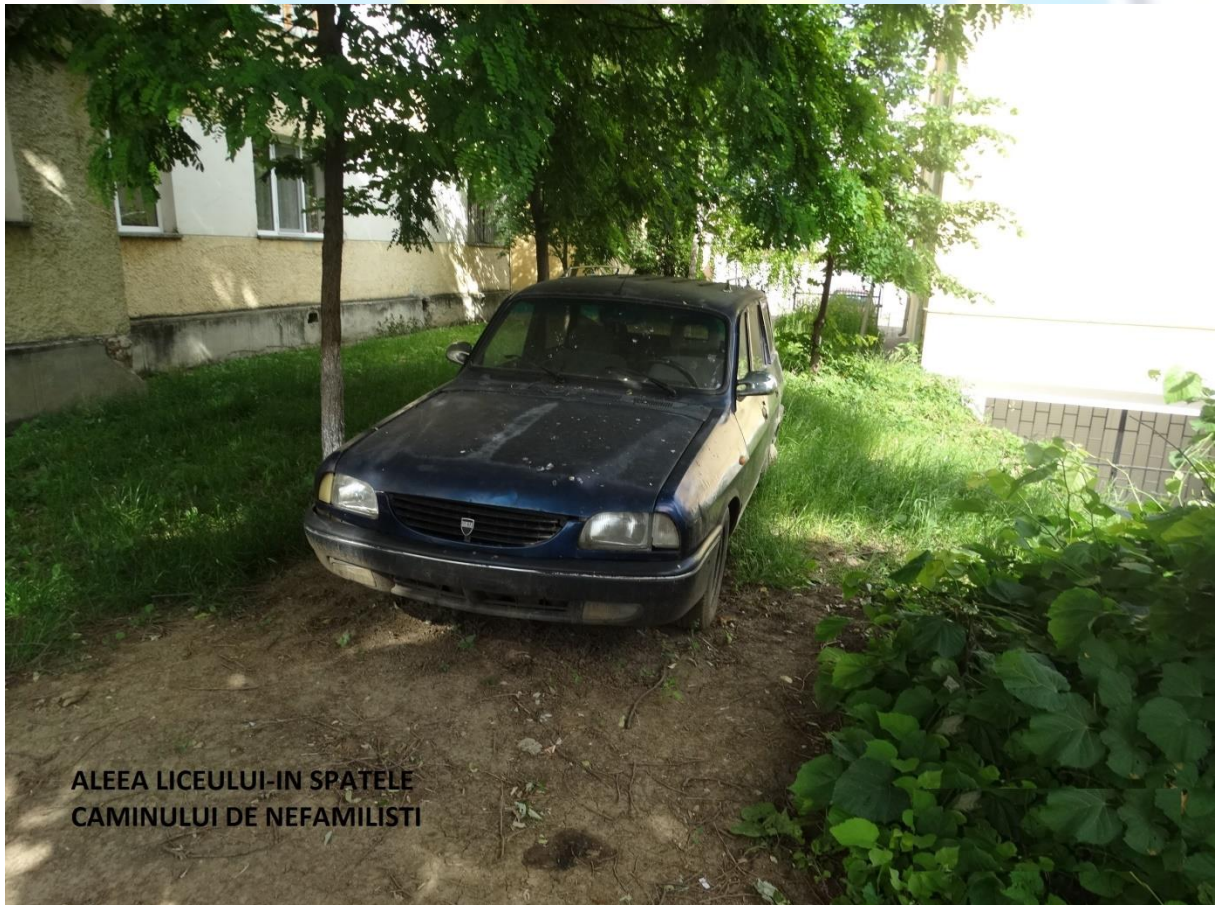
ALEEA LICEULUI- IN SPATELE CAMINULUI DE NEFAMILISTI