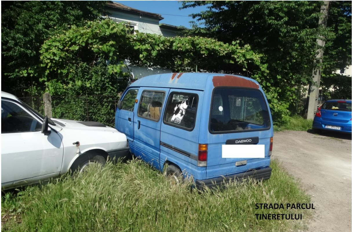
STRADA PARCUL TINERETULUI