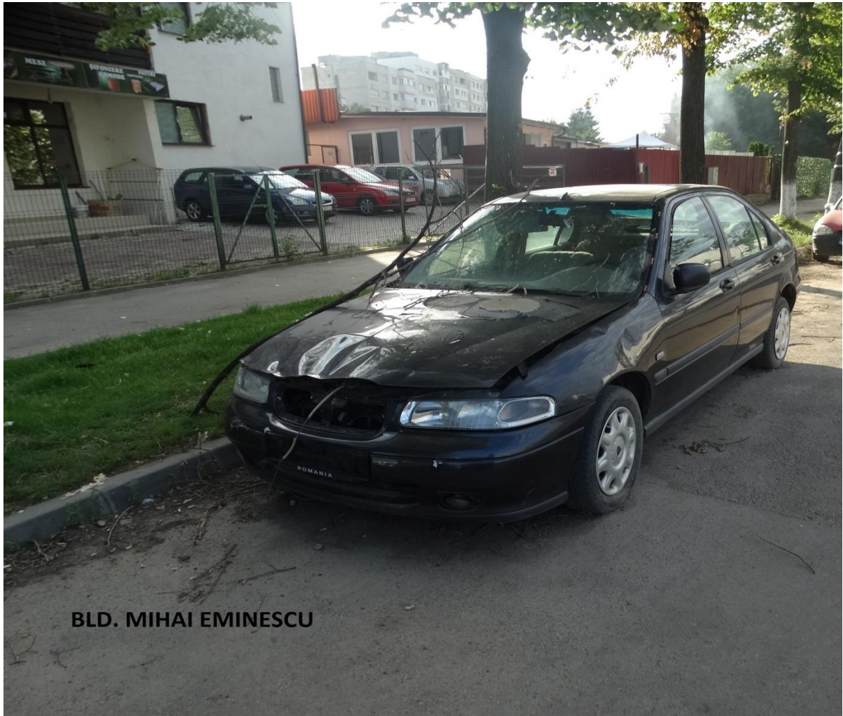
BLD. MIHAI EMINESCU