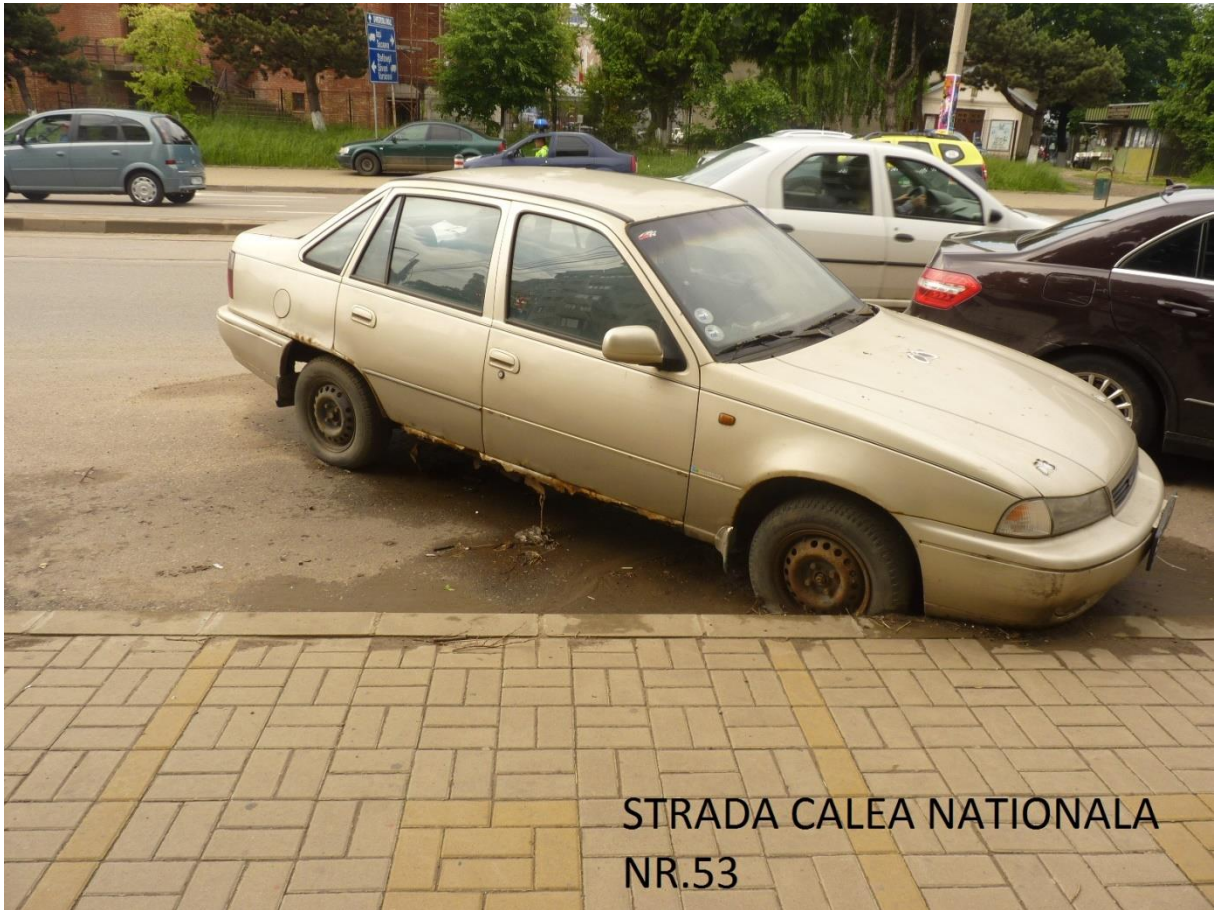
STRADA CALEA NATIONALA NR.53