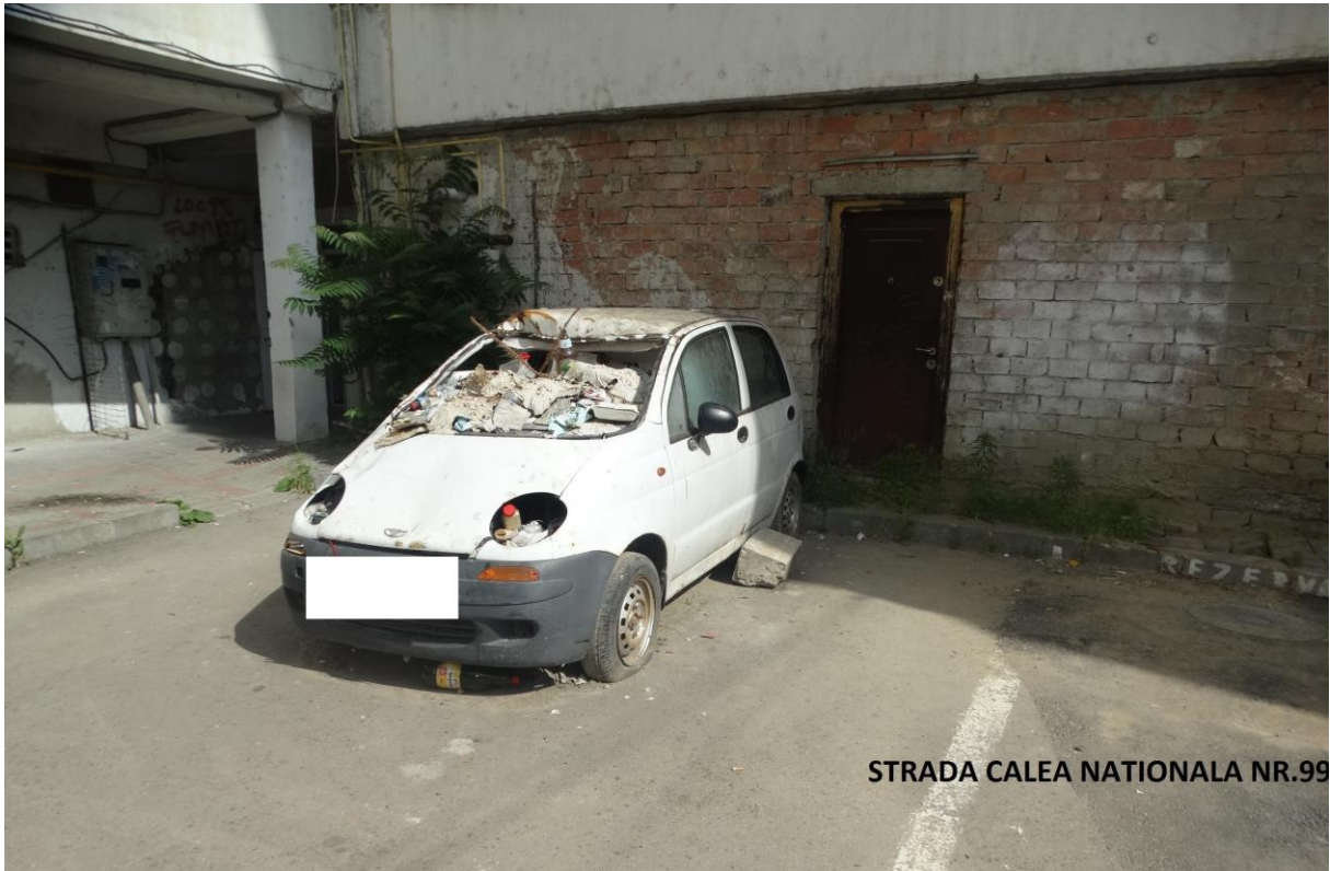
STRADA CALEA NATIONALA NR.99